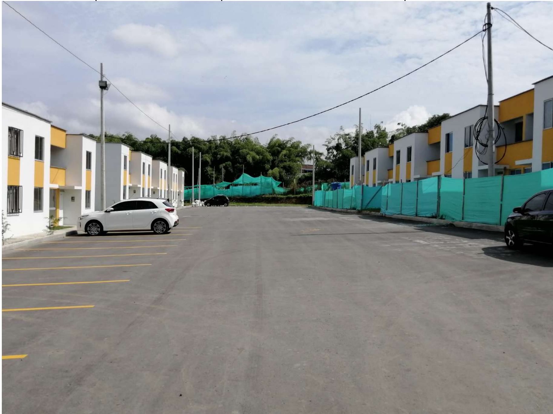
Izquierda: casas etapa 2. Derecha: casas etapa 3