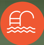
PISCINA ADULTOS Y NIÑOS