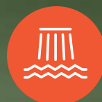
ZONA HÚMEDA DE CHORROS