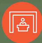
LOBBY DE ACCESO