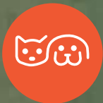
ZONA DE MASCOTAS